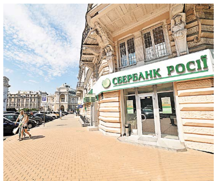
По размеру активов Сбербанк — второй среди частных банков Украины.

Игорь Зубков Национальный банк Украины готов инициировать введение санкций к украинской «дочке» Сбербанка. Об этом НБУ заявил сразу после того, как министр внутренних дел Украины Арсен Аваков призвал «изгнать» из Украины дочерний банк Сбербанка. Главе МВД не понравилось, что в России Сбербанк объявил о готовности обслуживать граждан паспортами Донецкой и Луганской республик во всех филиалах. Тут же украинские политики заговорили о запрете работы всех банков с российскими корнями на Украине. Банковскую систему украинские санкции до этого обходили стороной. Призыв Авакова абсурден. По размеру активов (48 миллиардов гривен по данным