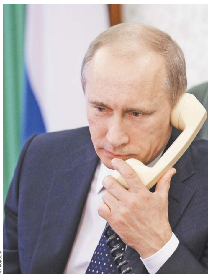
Президенты договорились поддерживать личные контакты.