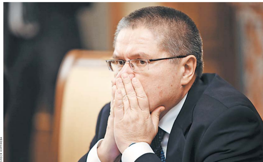
Министру Улюкаеву через считанные часы после задержания в СКР предъявили обвинение. Это означало, что у следствия все доказательства уже были на руках.

КОРРУПЦИЯ Суд продлил срок задержания фигурантам дела в Кузбассе на 72 часа