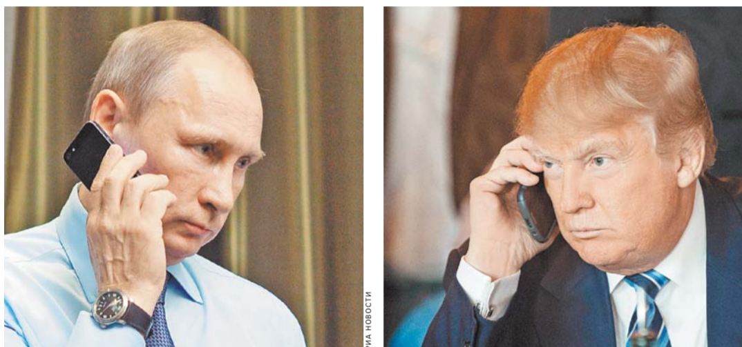
Владимир Путин и Дональд Трамп признали российско-американские отношения «крайне неудовлетворительными».