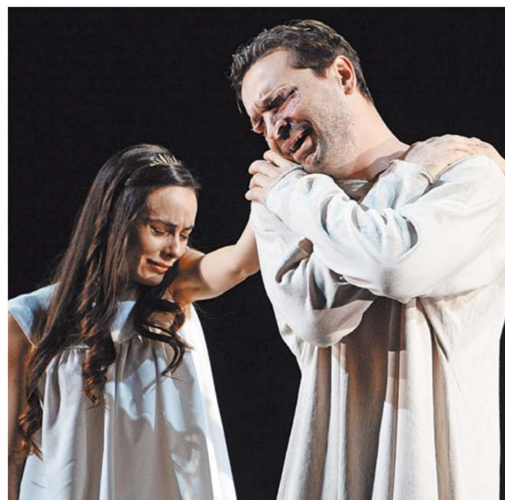
Страдания и сомнения царя Эдипа обращены теперь к зрителям XXI века — сквозь трагический гул жестокого и грубого времени, в котором жил.

Спектакль начинается с жалобы народа на свалившееся несчастье. Но хор разногласно и вопрошающе жалуется богам, все на сцене дышит еще вчерашней сытой и очень успешной жизнью. Эдип появляется в воспитательно-белом костюме, как олигарх, честно и справедливо (народ же живет устроено и сыто) отдохнувший. Царского в нем только цепь власти, похожая на модно недозавязанный галстук. В нем нет ни вульгарности, ни мафиозно-эстрадных итальянских манер, как, например, у Клавдия в Остермайеровском «Гамлете».