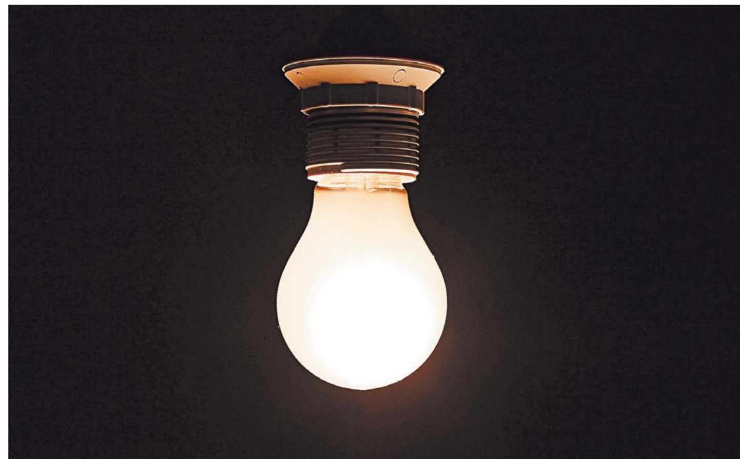
Пора от таких лампочек отказываться и переходить на энергосберегающие. Тарифы на электроэнергию выросли.

Елена Домчева С июля подорожали свет, вода, газ и тепло. Суммы в коммунальных платежах, которые мы получим в августе, вырастут в среднем на 4 процента. Это ниже инфляции и в два раза меньше, чем в 2015-м, уточнили в Минстрове.