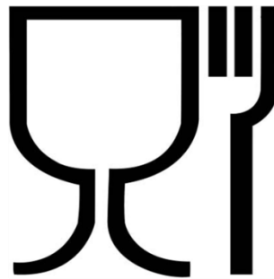
Рисунок 1 – упаковка (укупорочные средства), предназначенная для контакта с пищевой продукцией